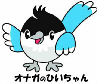
オナガのひいちゃん